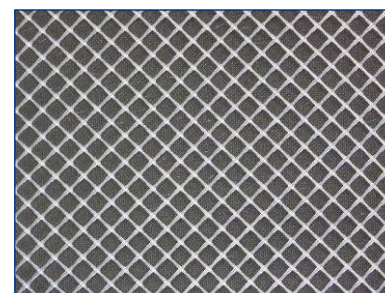
Polyamid- und Polypropylen-Matten in der Maschenweite 11 x 11 mm