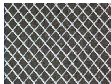
Polyamid- und Polypropylen-Matten in der Maschenweite 16 x 16 mm