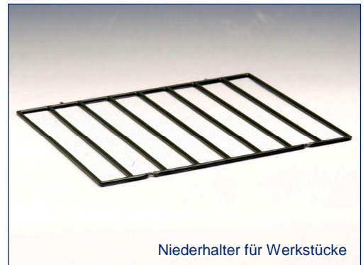
Niederhalter für Werkstücke