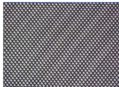
Polyethylen-Matten in der Maschenweite 4 x 4 mm