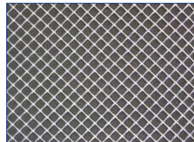
Polyamid- und Polypropylen-Matten