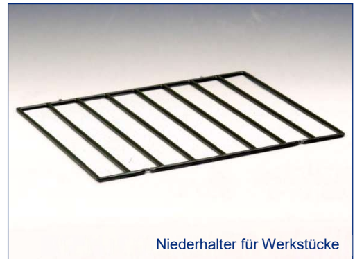
Niederhalter für Werkstücke