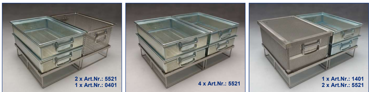
2 Lochblechkästen und Korb