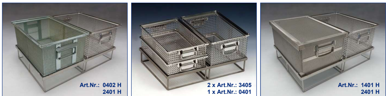
2 Körbe unterschiedlicher MW

Korb: 650 x 470 x 300 mm = Adapter 650 x 470 x 100 mm + 2 Körbe x 470 x 320 x 200 mm