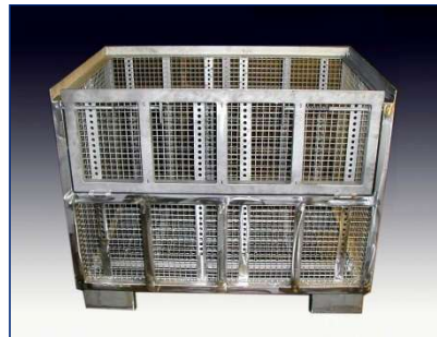
Gitterbox VA – mit Entnahmeklappe in halber Höhe