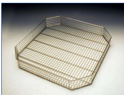
Korb für Drehtischanlagen