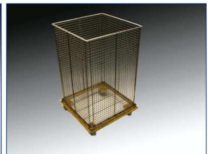
Korb für hohe Teile auf Rollenwagen