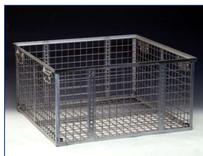
leichte Korbausführung für z.B. große Aluminiumteile