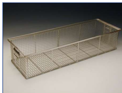
Korb für lange Werkstücke