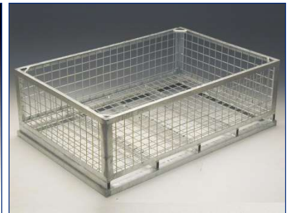
Gitterbox für Europaletten – Stapelrand unten