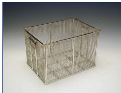
Korb für hohe Werkstücke