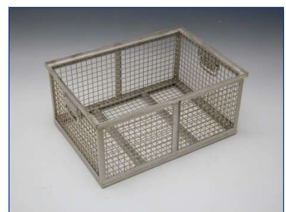
Korb mit doppeltem Bodenprofil für hohe Gewichte