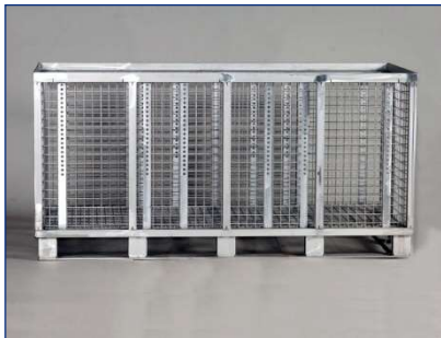
Gitterbox VA – Länge 2000 mm – für Rollenbahn geeignet

Groß- und Schwerlastkörbe für große Teile und große Mengen