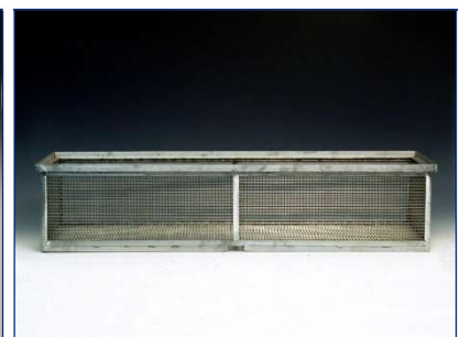
Korb für 2-spurige Bundrollenbahn